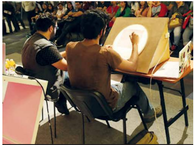
Buscan consolidar 33 mil empleos en ramas como post producción, animación, multimedia, VFX* y videojuegos.

30 En Jalisco, tras analizar esta problemática, se constituyó, sin ánimos de lucro, la Asociación Jalisciense de Industrias Creativas el 28 de abril de 2015, para promover iniciativas privadas y públicas con programas de capacitación, adopción de modelos de calidad, competencia leal y sustentabilidad.